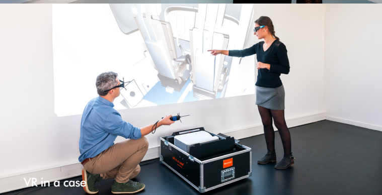
VR in a case